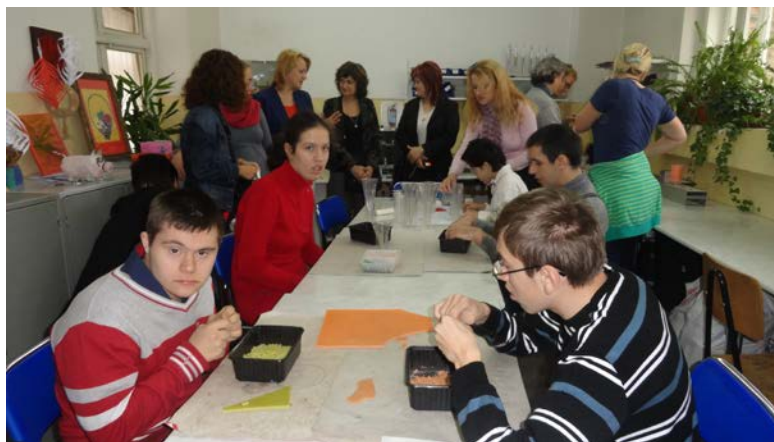
2.attēls. Projekta sanāksmes dalībnieki vēro bērnu praktiskās nodarbības Bukarestes 10.speciālajā skolā

Sanāksmes pirmajā dienā 5.novembrī mēs viesojāmies Bukarestes 10.speciālajā skolā, kur mūs un arī pārstāvjus no Turcijas un Vācijas sagaidīja ar sālmaizi. No Turcijas un Vācijas skolām uz sanāksmi bija ieradušies pa četriem pārstāvjiem, bet Rumāniju pārstāvēja trīs dalībnieces. Pēc sanāksmes dalībnieku savstarpējas iepazīšanās un skolas apskates noklausījāmies katras valsts pārstāvju informāciju par savu skolu, pilsētu un valsti. Pirmajā kafijas pauzē katras valsts pārstāvjiem bija jāliek galdā attiecīgajai valstij raksturīgs ēdiens. Mēs no praktiskā viedokļa kā piemērotāko līdzvešanai uz Rumāniju izvēlējāmies Lāču rupjmaizi ar žāvētiem augļiem un riekstiem. Turcijas pārstāvji sanāksmes dalībniekus cienāja ar saldumiem: dažādu garšu un krāsu ledenēm un lukumu. Savukārt kā rumāņu ēdieni uz galda tika likti dārzenų biezeņi ar baltmaizi un vairāku veidu kūksi.