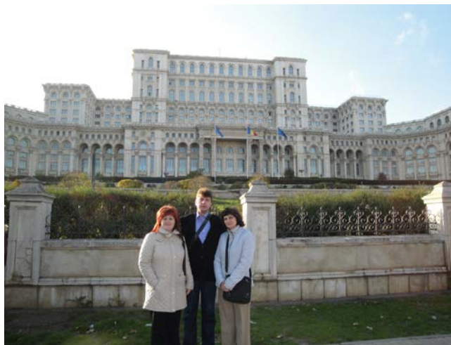
4.attēls. Mūsu skolas delegācija pie Eiropā lielākās ēkas

objektiem. No tālienes apskatījām arī kādreizējā Rumānijas komunistiskā diktatora Nikolajes Čaušesku pili, kas tagad ir Rumānijas parlamenta mājvieta un tiek saukta par Parlamenta pili ( Palatul Parlamentului ). Informācija Vikipēdijā liecina, ka Rumānijas Parlamenta pils platības ziņā ir lielākā ēka Eiropā. Ēkas būvniecība tika uzsākta 1984.gadā Nikolajes Čaušesku valdīšanas laikā. Tolaik tika iecerēts, ka ēka apvienotu Čaušesku personīgo rezidenci, kā arī valsts politiskās un administratīvās pārvaldes nozīmīgākās institūcijas. Pils atrodas pašā Bukarestes centrā un, lai tās celtniecībai atbrīvotu vietu, 1980.gadā tika nojaukts pilsētas vēsturiskais centrs, tajā skaitā 19 pareizticīgo baznīcas, sešas sinagogas, trīs protestantu baznīcas un 30 000 mājvietas. Brīdī, kad 1989.gadā krita Čaušesku režīms, pils būvniecība bija pabeigta, taču turpinājās tās iekšdarbi. Krītot režīmam, šie darbi pārtrūka un daļa iekšdarbu tā arī nekad netika veikti – par to liecina daudzās tukšās pils telpas.