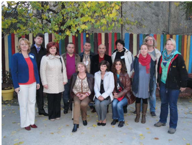
1.attēls. Projekta sanāksmes dalībnieki Bukarestes 10.speciālās skolas pagalmā